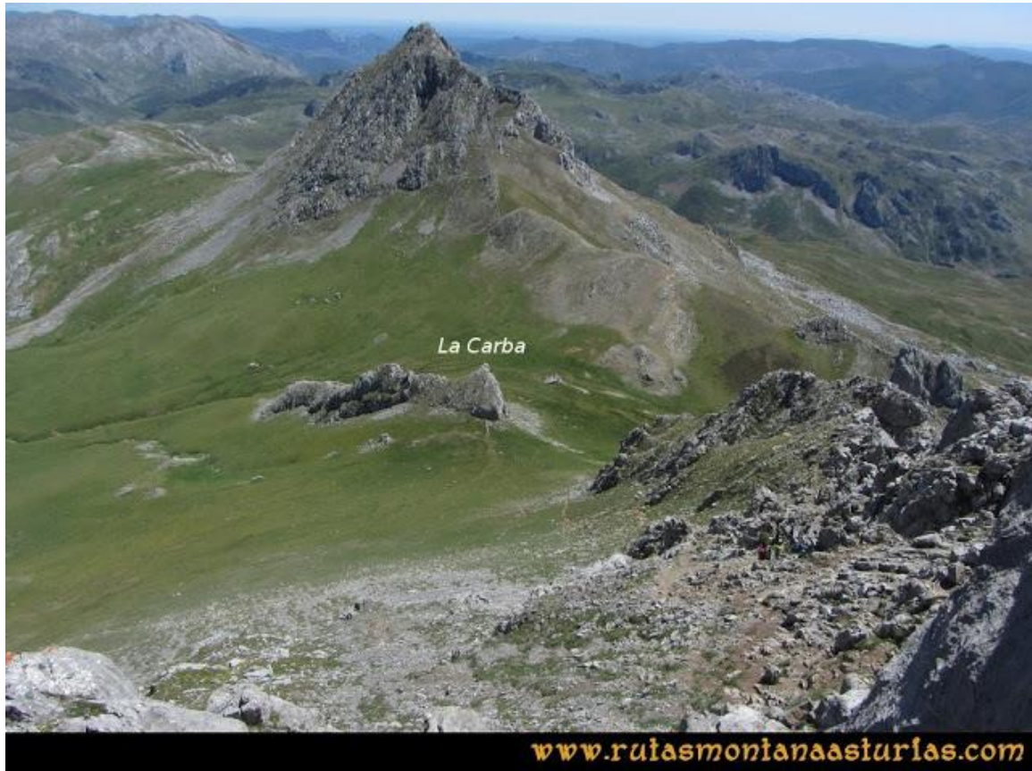
Collado de Terreros

para después seguir hasta el collado de Terreros con La Carba y Peña Ubiña Pequeña como referencia