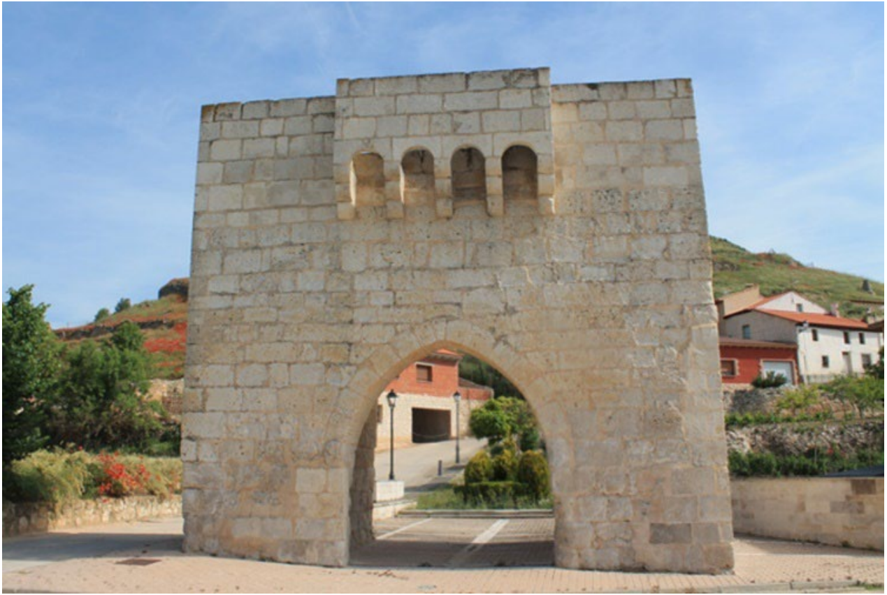
ARCO DE LA MURALLA - ARCO DE LA MAGDALENA