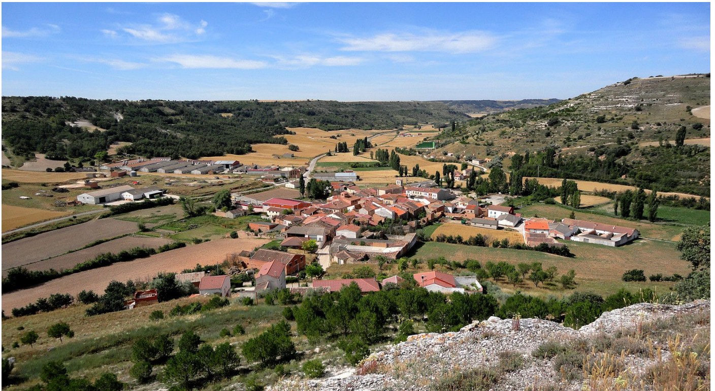
VALDEARCOS DE LA VEGA