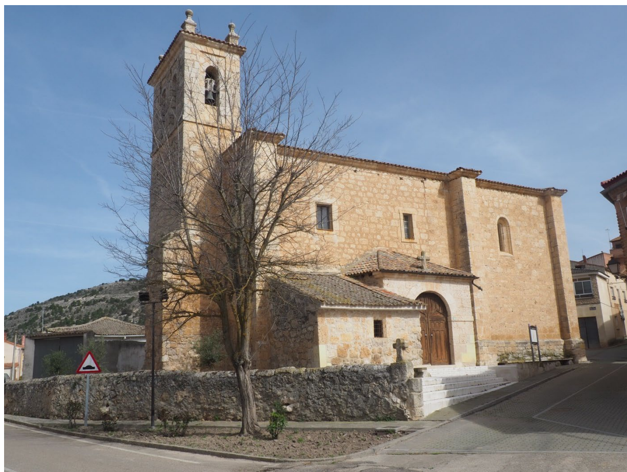
IGLESIA DE LA ASUNCIÓN DE VALDEARCOS