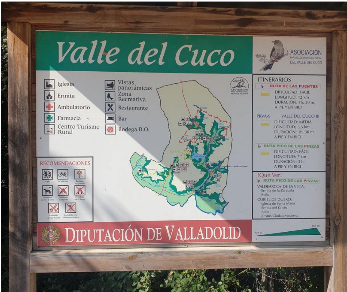
CARTEL DE INFORMACIÓN DEL VALLE DEL CUCO