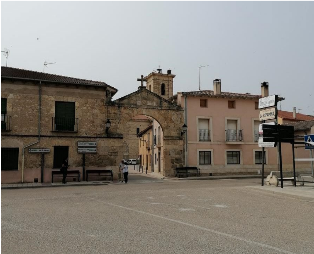
ARCO DE LA VILLA

seguiremos hasta llegar al Arco de la Villa