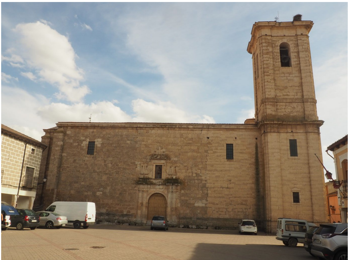
IGLESIA DE SAN JUAN