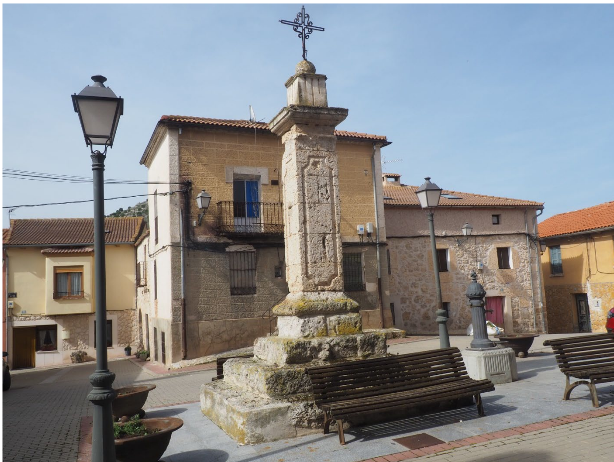
ROLLO DE JUSTICIA DE VALDEARCOS