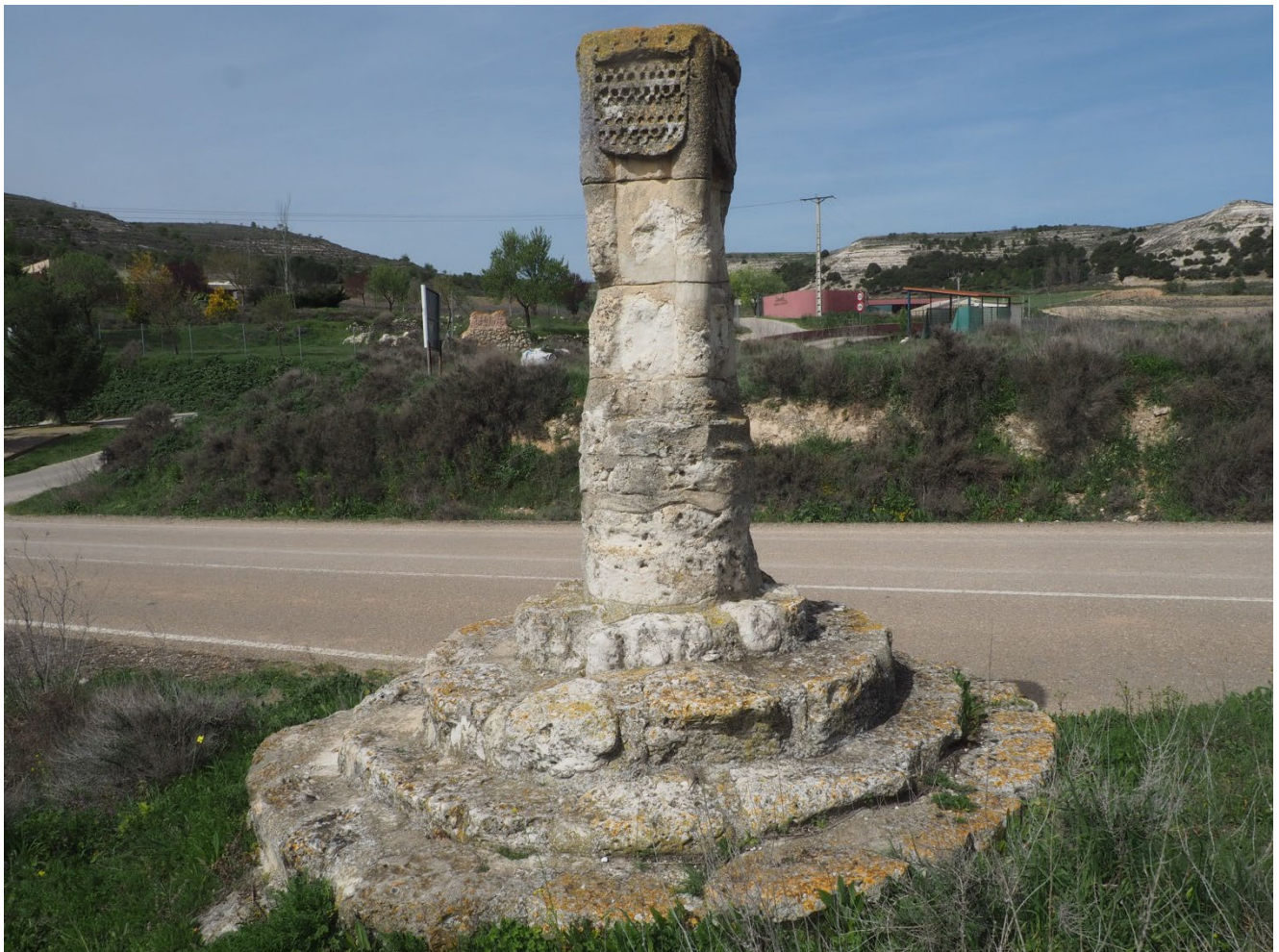
ROLLO DE JUSTICIA