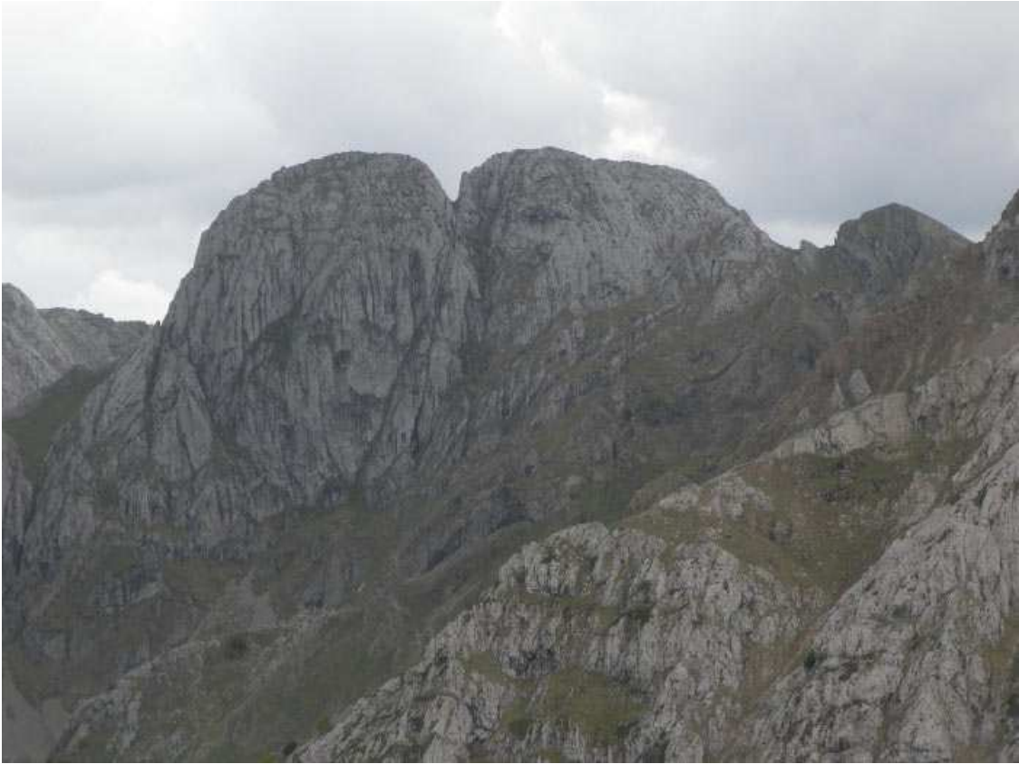
vista de Salamón descendiendo del Pico Llerenes