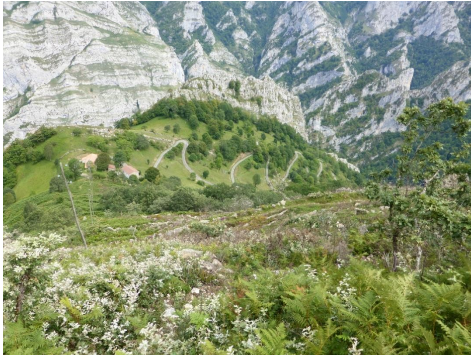
Ruta corta: por el zigzag del Camín del Llaciú hacia Casielles.

La ruta completa prosigue desde la collada el Baxeñu, a 1034 m, tomando el camino que se dirige al sureste y luego al sur para conectar con el sedo Vibolines, que nos dirigirá al pueblo de Casielles.